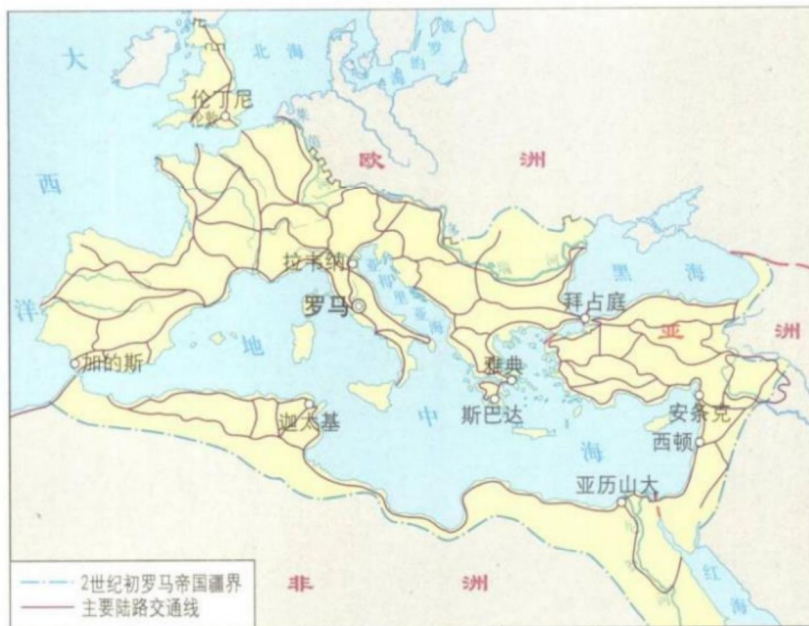
图5-2 罗马帝国道路分布