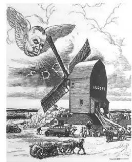
第 22 题图